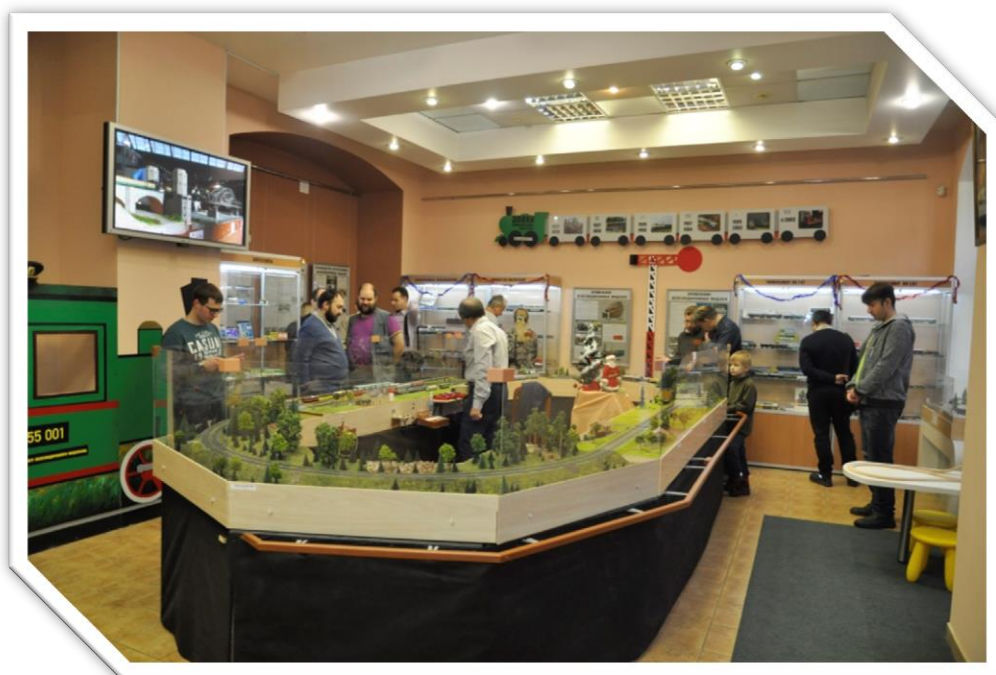
Фото 1. Модульный макет в типоразмере ТТ в день открытия.