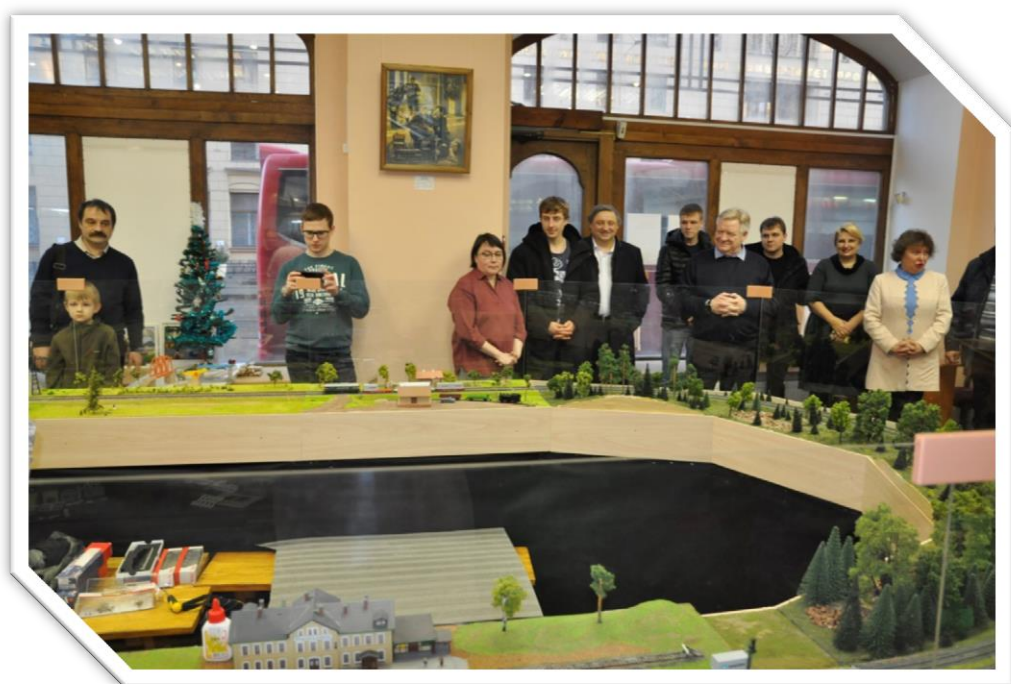
Фото 5. Торжественный запуск движения на модульном макете в день открытия.