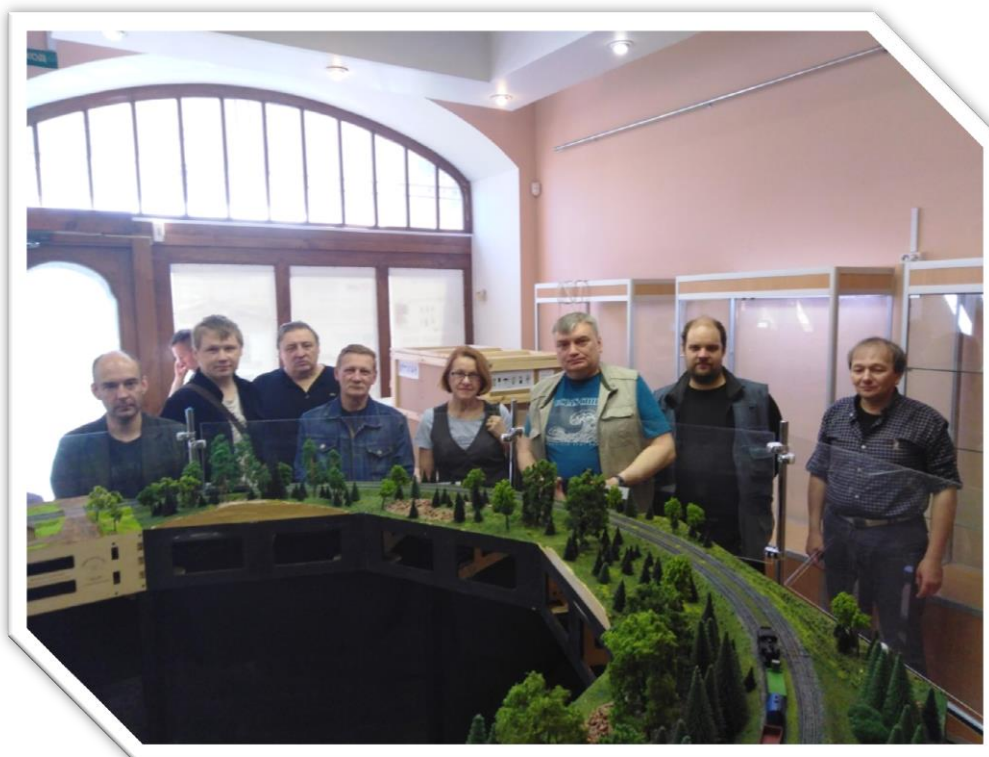
Фото 8. Творческие встречи моделистов. Старт создания клуба, май 2019 года.