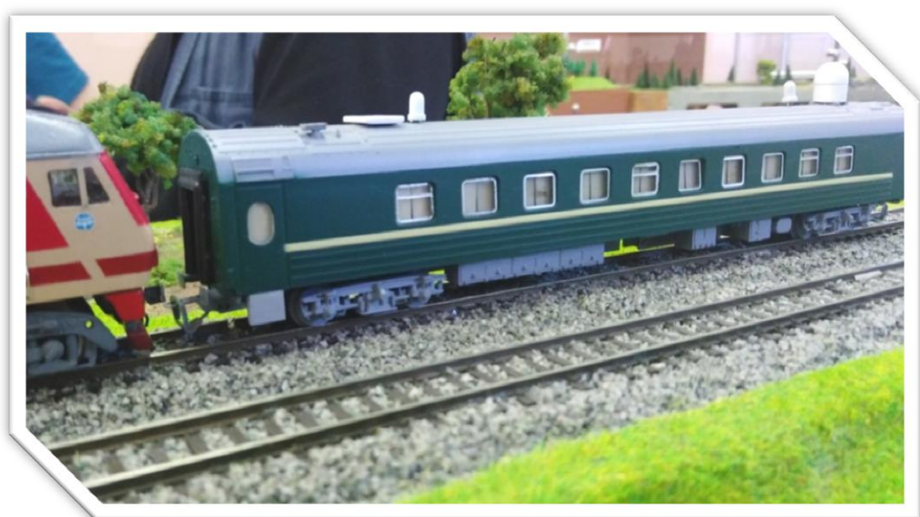
Фото 6. Модель вагона-салона в типоразмере ТТ от моделиста Игоря Иванова.