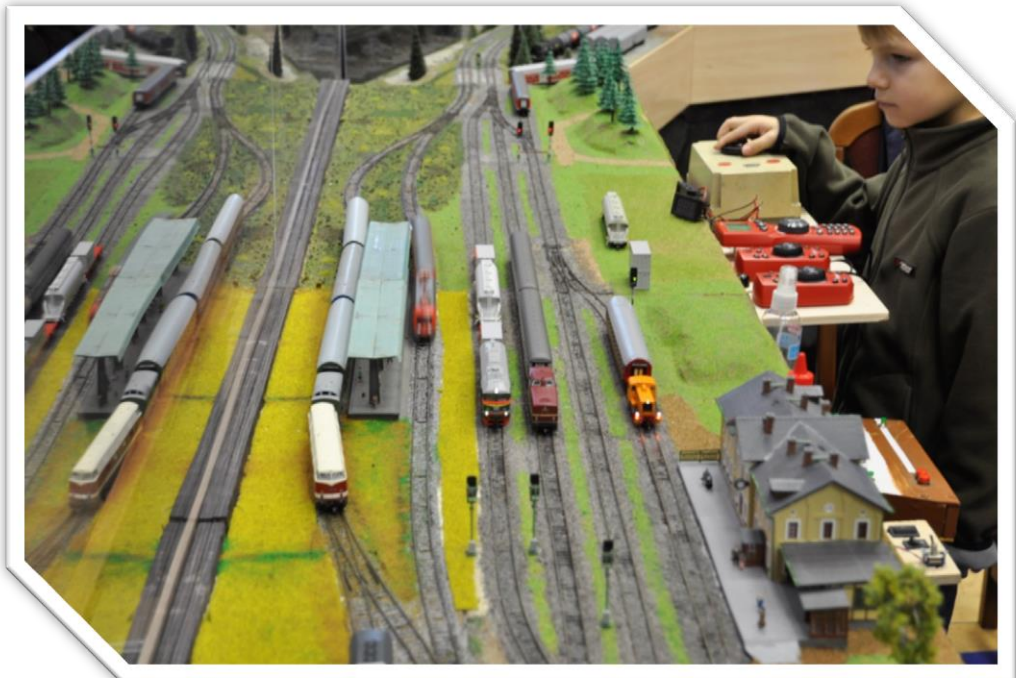
Фото 4. Подвижной состав на модульном макете в день открытия.